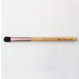
アイシャドウブラシ