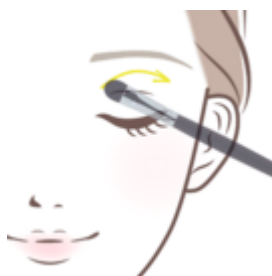
アイシャドウブラシ使い方