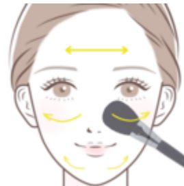
パウダーブラシ使い方