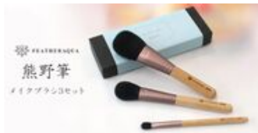
熊野筆メイクブラシ3本セット