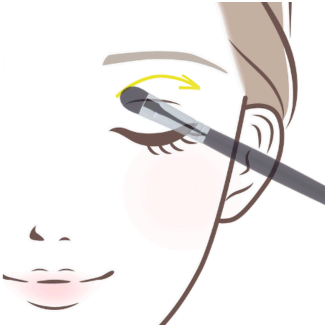
アイシャドウブラシ使い方