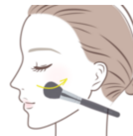
チークブラシ使い方