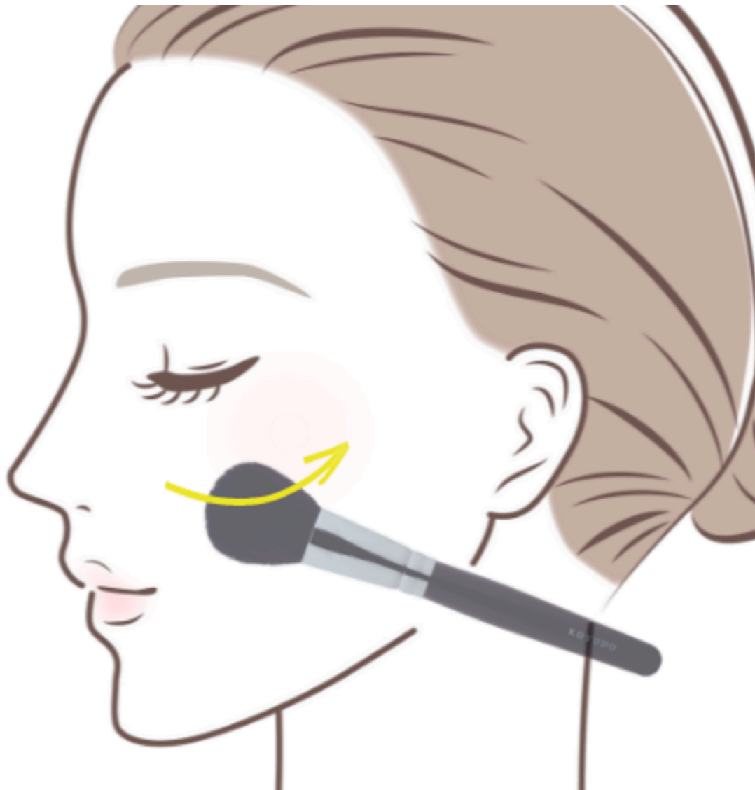
チークブラシ使い方

今回、FFF SMART LIFE CONNECTED株式会社 WEBダイレクトショップはじめ、各WEBショッピングモールにて送料込み13,000円(税込)で販売開始いたします。