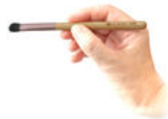
アイシャドウブラシ2