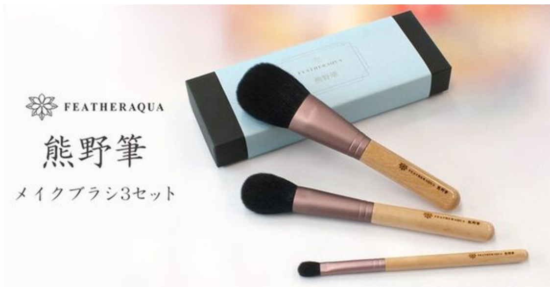
熊野筆メイクブラシ3本セット

また、FEATHER AQUA JAPAN製品の第一弾として、伝統的な技法で製造された「熊野筆」のメイクブラシ3本セット(パウダーブラシ/チークブラシ/アイシャドウブラシ)を2024年8月20日に発売いたします。